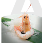
S5 SASHIMI SCAMPI 1PZ scampi 3.00 € B